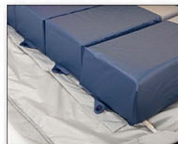
enkele verwijderbare polyurethaancellen