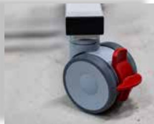
Standaard geleverd met vier 100 mm geremde dubbele zwenkwielen. Rechte besturing mogelijk.