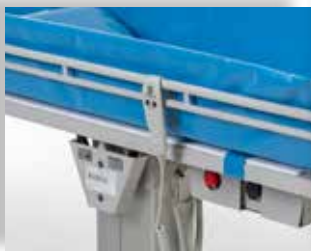
Standaard geleverd met voetbediening. Handbedieningsoptie beschikbaar (plug & play).