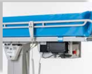
Standaard geleverd met ingebouwde accu. Verwijderbare accu als optie beschikbaar.