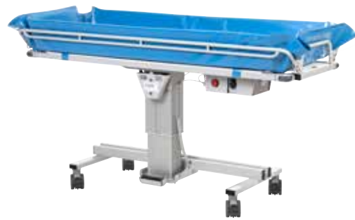
TR 3000 H