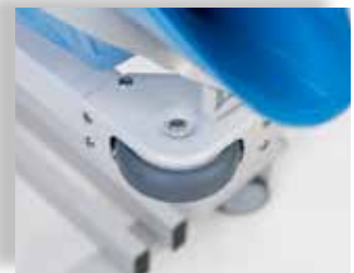
Standaard bumperwielbescherming in alle vier de hoeken.