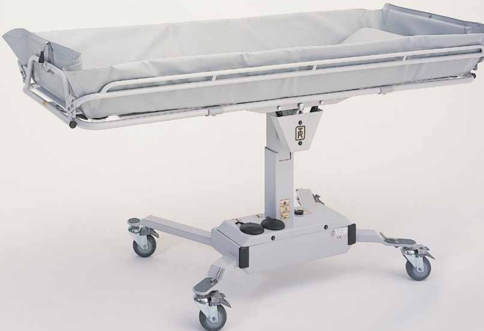
TR 3000 H, DE ELEKTRISCH IN HOOGTE VERSTELBARE DOUCHE-BADWAGEN