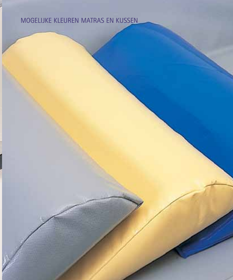
MOGELIJKE KLEUREN MATRAS EN KUSSEN