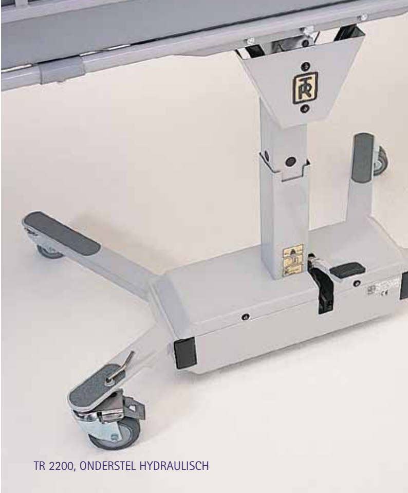
TR 2200, ONDERSTEL HYDRAULISCH