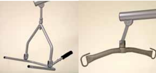
MARY, PASSIEVE TILLIFT